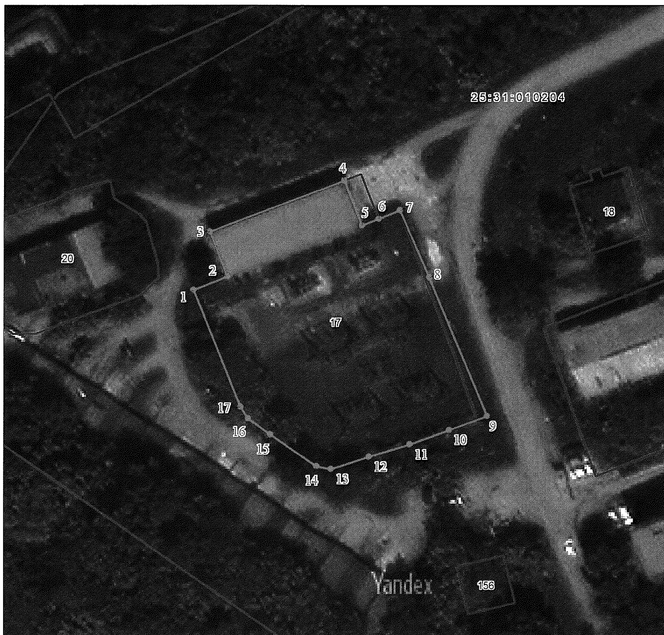
СХЕМА РАСПОЛОЖЕНИЯ ГРАНИЦ ПУБЛИЧНОГО СЕРВИТУТА объекта электросетевого хозяйства ПС-110 кВ "ЖБФ"